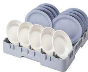
Casier à plot 5 x 9