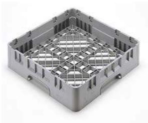
Casier de base taille standard