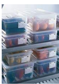
Bac de stockage