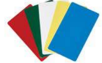
Étiquettes d'identification EPPID5