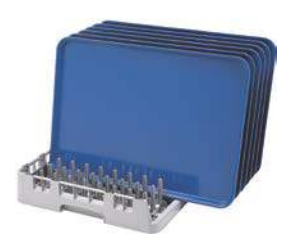
Casier à extrémité ouverte pour plateaux