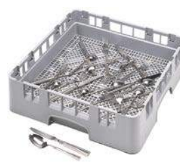
Casier à couverts