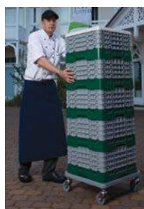
Casier de lavage

Email : contact@avelinepro.fr TEL : 02 47 63 18 92 – FAX : 02 47 44 12 42 44 avenue Jacques Ducloux – 37700 Saint-Pierre-Des-Corps